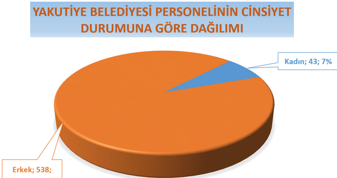
Şekil 2: Yakutiye Belediyesi Personelinin Cinsiyet Durumuna Göre Dağılımı

Aşağıdaki grafikte Yakutiye Belediyesinin personellerinin (Memur, Sürekli İşçi, Sözleşmeli Personel, Taşeron İşçi, Meclis Üyesi Başkan Yardımcıları) cinsiyete göre dağılımı verilmiştir. Buna göre belediyenin çalışanlarının %93'ü (538 kişi) erkek ve %7'sini (43 kişi) kadın personellerden oluşmaktadır.