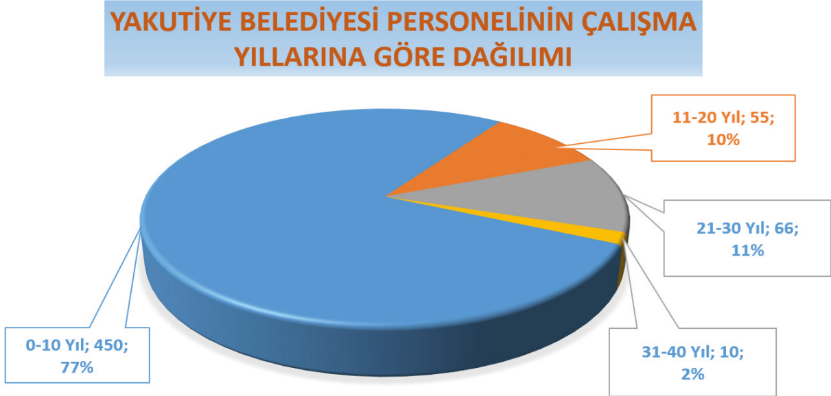
Şekil 4: Yakutiye Belediyesi Personelinin Çalışma Yıllarına Göre Dağılımı

Yukarıdaki grafiğe bakıldığında Yakutiye Belediyesi personelinin (Memur, Sürekli İşçi, Sözleşmeli Personel, Taşeron İşçi, Meclis Üyesi Başkan Yardımcıları) % 77'si 0-10 Yıl, %10'u 11-20 yıl, %11'i 21-30 yıl ve %2'si 31-40 yıllık bir süreçte belediyeye hizmet vermiş ve vermeye devam etmektedirler.