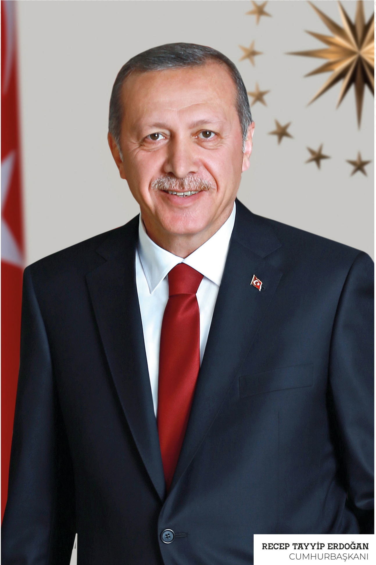
RECEP TAYYİP ERDOĞAN CUMHURBAŞKANI